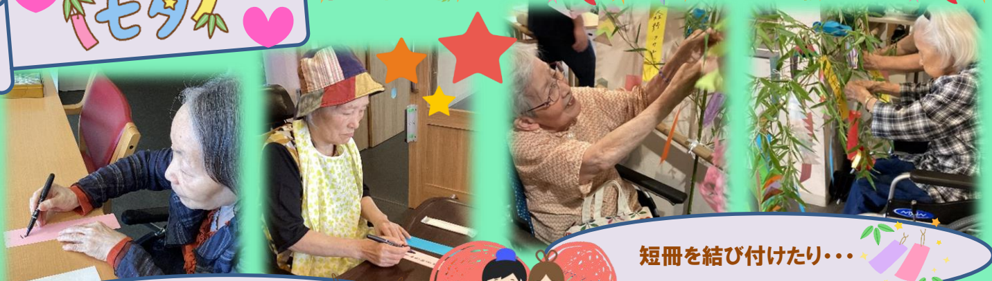
短冊に願いを書いたり...