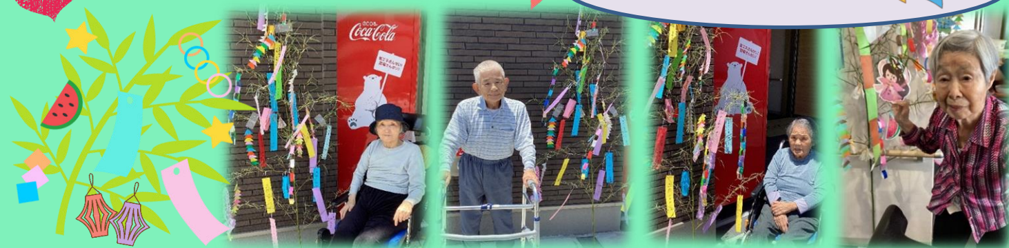
笹と一緒に写真撮影