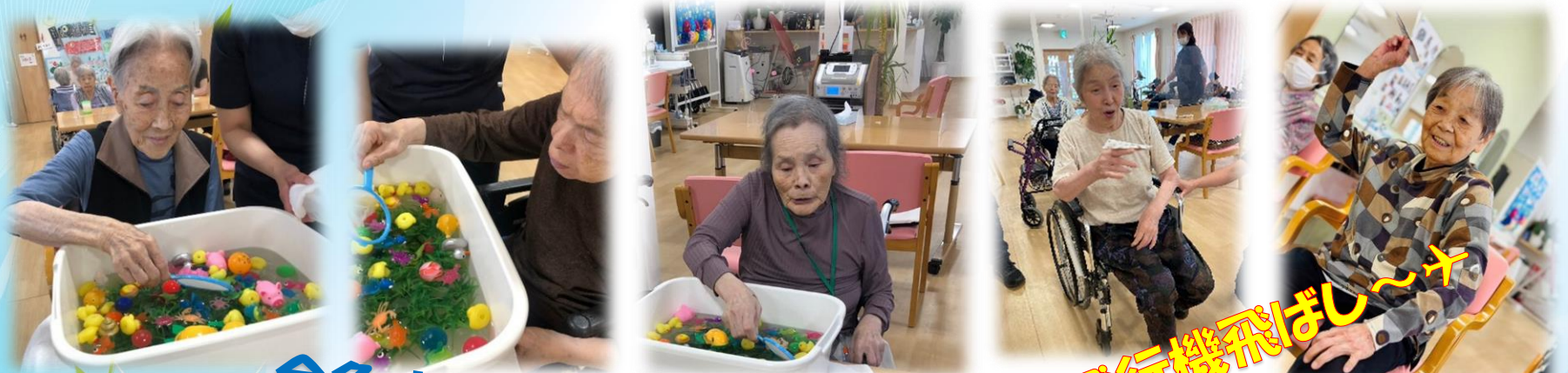
金魚すくいゲーム