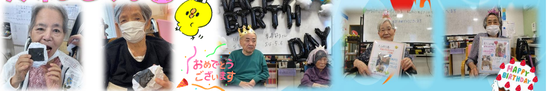
お誕生日の皆様おめでとうございます！